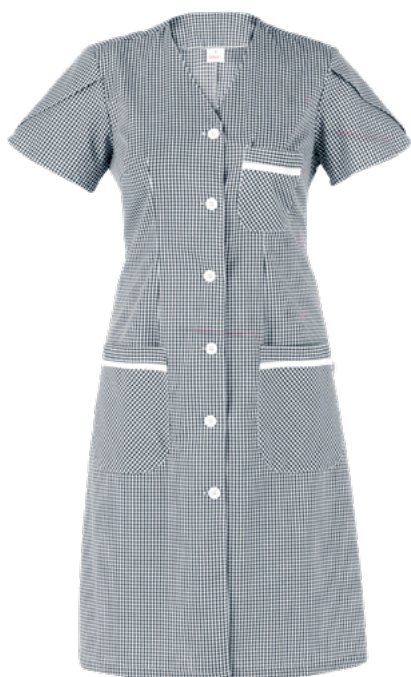
Q32 Quadro nero