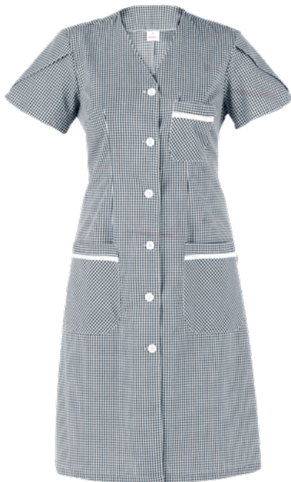
Q32 Black check