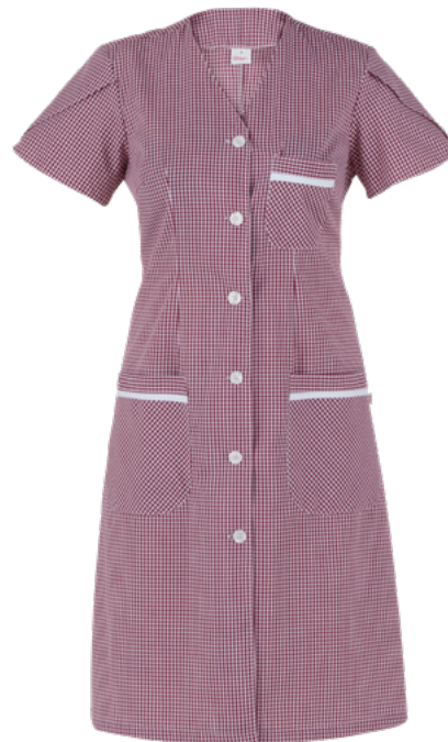
Q35 Bordeaux check